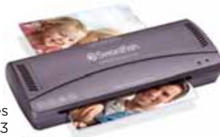
Compact Series A4, A3